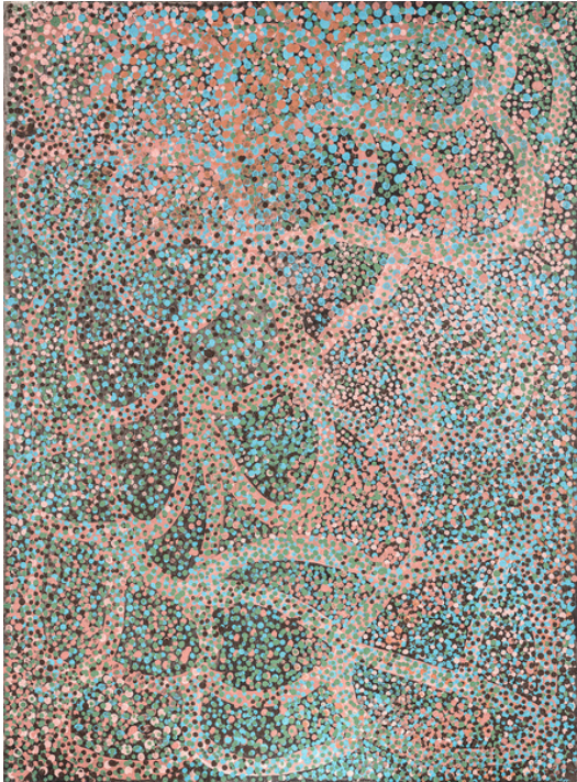
Emily Kam Ngwarray (c.1914-1996) Alhalker, 1990 Acrylique sur toile Collection Bérengère Primat, Courtesy Fondation Opale