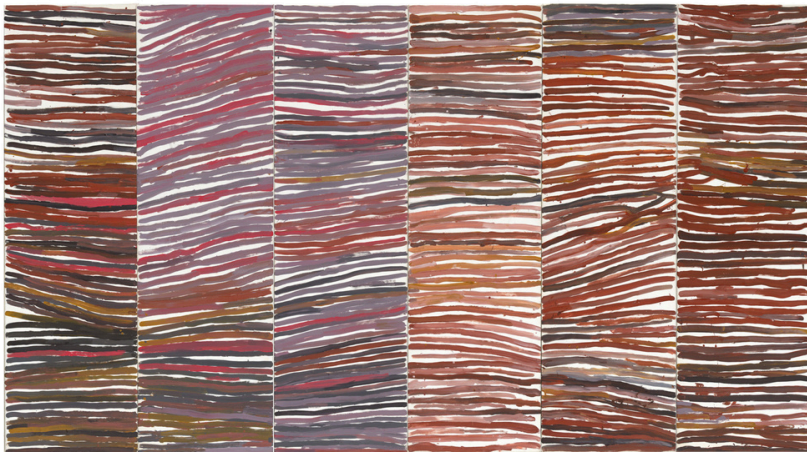
Emily Kam Ngwarray (c.1914-1996), Anmatyerr people Untitled (awely), 1994 National Gallery of Australia, Kamberri/Canberra, purchased 2022, with the assistance of the Foundation Gala Funds 2021 and 2022, in celebration of the National Gallery of Australia's 40th anniversary, 2022