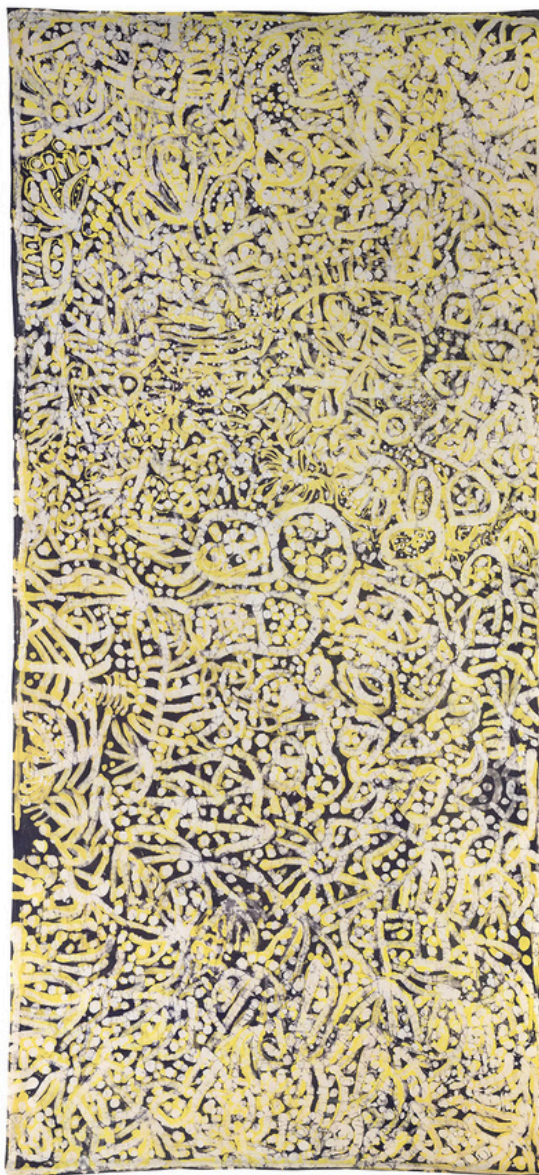
Emily Kam Kngwarray (c.1914-1996) Alhalker, 1987 Batik sur coton / Batik on cotton Collection Bérengère Primat, Courtesy Fondation Opale

Emily Kam Kngwarray a pratiqué le batik pendant onze ans avant de commencer à peindre à l'acrylique sur toile.