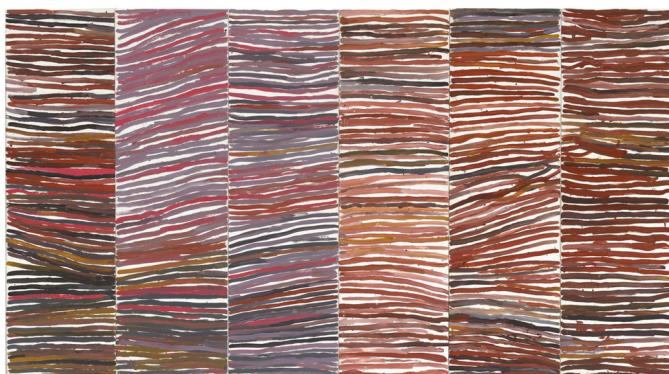
Emily Kam Kngwarray (c.1914-1996) Anmatyerr people Untitled (awely), 1994 National Gallery of Australia, Kamberri/Canberra, purchased 2022 with the assistance of the Foundation Gala Funds 2021 and 2022, in celebration of the National Gallery of Australia's 40th anniversary, 2022

Certaines œuvres ont été exposées à la Biennale de Venise en 1997; Emily Kam Kngwarray faisait partie des trois artistes aborigènes sélectionnées pour représenter l'Australie cette année-là.