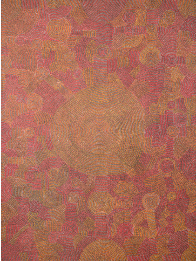
Josie Kunoth Petyarre (1959) Miel sauvage / Sugar Bag , 2018 Acrylique sur toile de lin Collection Bérengère Primat, Courtesy Fondation Opale © Josie Kunoth Petyarre/Copyright Agency/2026, ProLitteris, Zurich